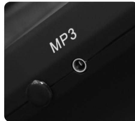
Воспроизведение аудио при помощи AUX