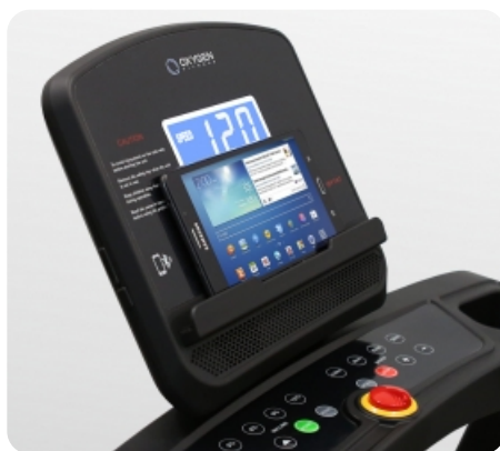
Подставка для гаджетов