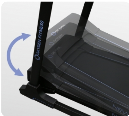
Электрически изменяемый угол наклона от 0 до 15%