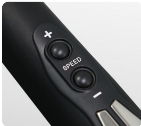
Дополнительные кнопки переключения наклона и скорости