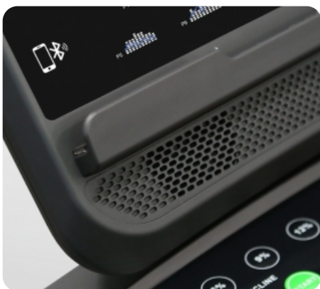
Встроенные динамики мощностью 3 Ватт