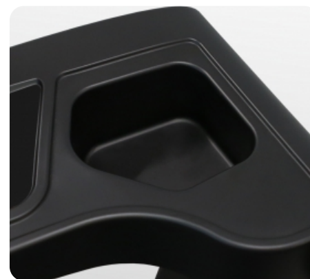
Подставка под бутылочку с водой