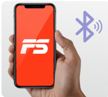
Синхронизация оборудования с мобильным приложением FitShow