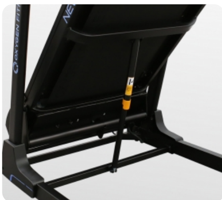
Легкое складывание за счет двухфазной гидравлики easyFOLD™