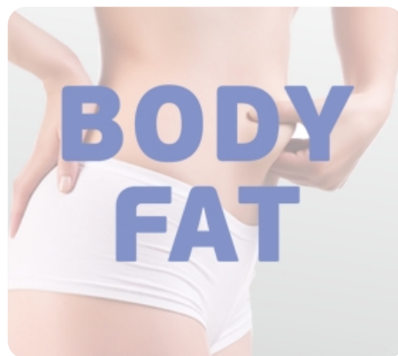
Режим жироанализатора Body Fat для определения комплекции организма