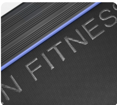
Двухслойное полотно Habasit NVT-256 (толщина 1,6 мм.)