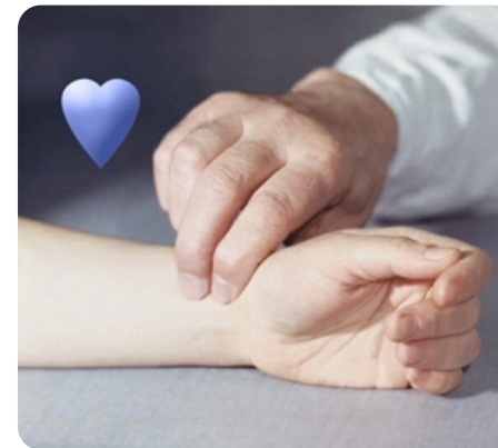
3 пульсозависимые программы