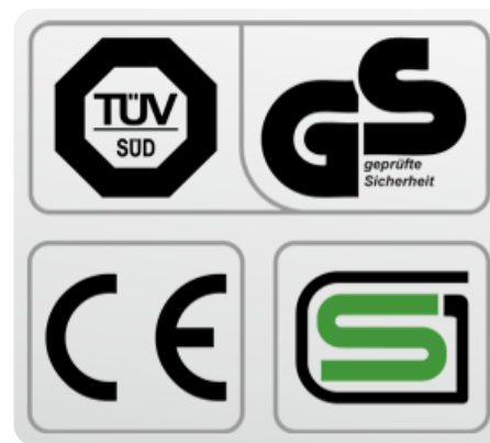
Обязательные сертификаты: европейский CE, немецкий GS TÜV, японский SG