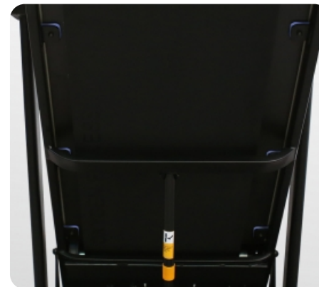
8 плоских эластомеров Natural™