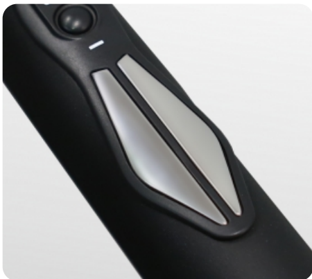
Сенсорные датчики пульса