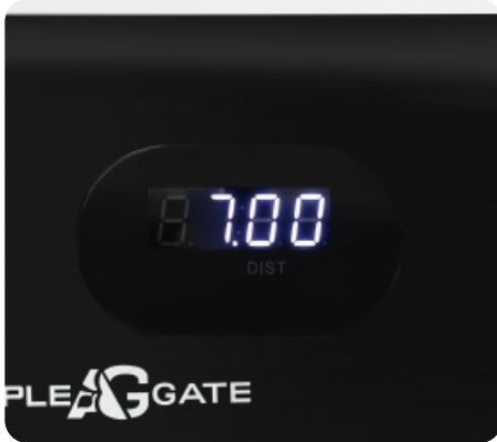
Дополнительный дисплей с необходимыми показателями