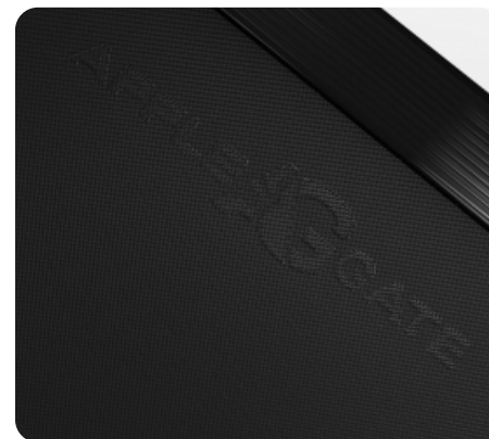
Беговое полотно толщиной 1.8 мм