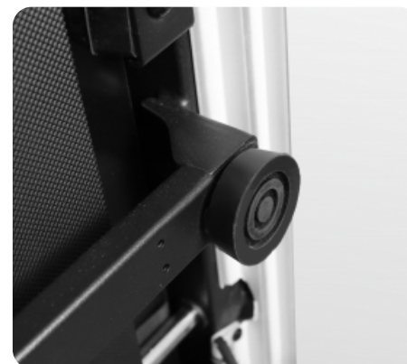
Дополнительные компенсаторы неровностей пола