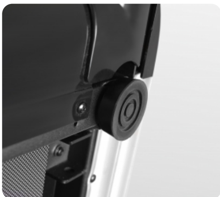
Компенсаторы неровностей пола