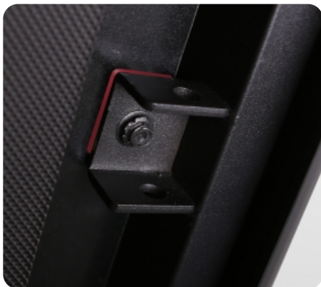
Амортизация на основе 4-х плоских эластомеров Natural™