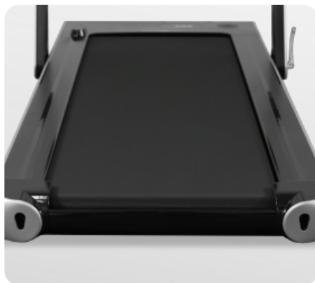
Беговое полотно 110*40 см