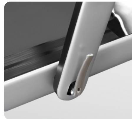
Система складывания стойки тренажера