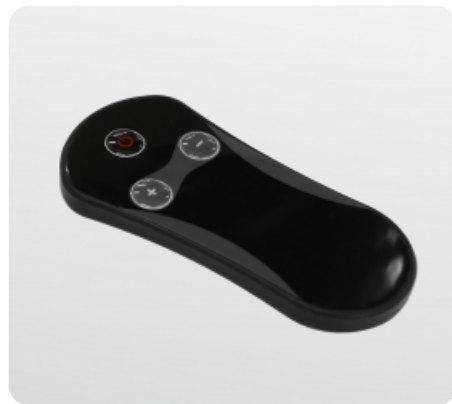
Дистанционный пульт управления дорожкой