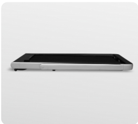
Высота дорожки в сложенном виде 13,3 см