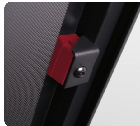
Дополнительные эластомеры Soft-Recovery™