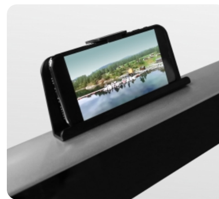
Подставка под телефон