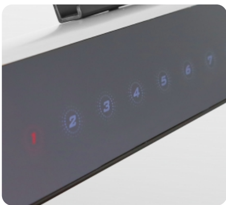
Сенсорная консоль с клавишами быстрого доступа